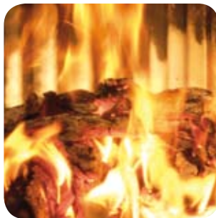
Luftzufuhr erst drosseln, wenn sich ein schöner Glutstock gebildet hat.